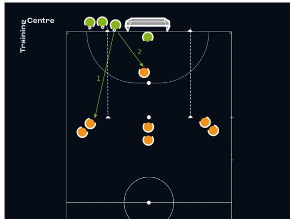
Dos opciones para iniciar la secuencia.