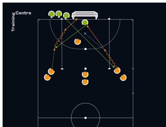
2 contra 1