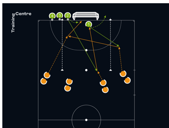
Séquence de base