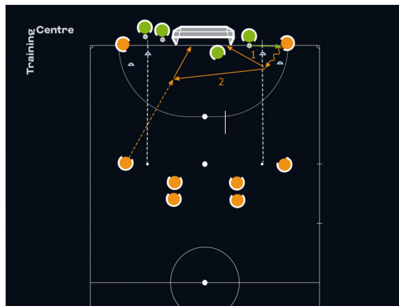
Options pour le joueur excentré